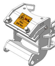
Bredt klemmebeslag (fikstur)