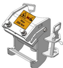
Smalt klemmebeslag (fikstur)